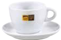
Art. 8302 Cappuccinotassen AC Tazze da cappuccino AC Cappuccino cups AC 6 Tassen/tazze/cups