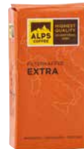
Art. 5521 Filterkaffee EXTRA 1000 g Gemahlen/macinato/ground

The hearty filter coffee is compelling with its well-balanced acidity and spicy aromas. 90% Arabica beans from Central and South America and East Africa, as well as 10% Robusta beans from West Africa and South Asia give this coffee blend its typical aroma.