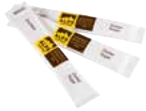
Art. 8011 Zucker in Sticks Zucchero in stick Sugar in sticks 2,8 g 10 kg Karton/cartone/carton