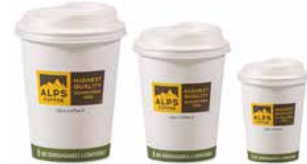
Art. 8371 Espresso Coffee to go 120 ml 50 Stück/pezzi/pieces