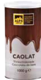
Art. 8050 Caolat 1000 g Dose/barattolo/tin

Caolat drinking chocolate – Preparation for hot chocolate-flavoured drink