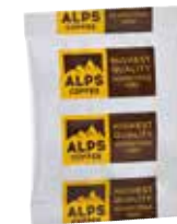
Art. 4711 Filterkaffee SPEZIAL 70 g Gemahlen/macinato/ground

The portioned filter coffee (70 g for 12 cups and 80 g for 16 cups). A filter coffee blend with mild delicate acidity which is extremely aromatic. Full, yet mild in taste.