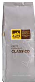
Art. 1320 Caffè Espresso CLASSICO 1000 g Bohnen/in grani/beans

This very special espresso has extremely low acidity and strong aroma. 70% Arabica beans from Central America and East Africa, as well as 30% Robusta beans from West Africa make for a very full body and soft taste. Excellent roasting flavours and notes of dried fruit give this harmonious coffee blend its unique character.