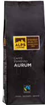
Art. 1820 Caffè Espresso AURUM 1000 g Bohnen/in grani/beans

A well-balanced and fruity espresso with lasting notes of bitter chocolate, mild flavour and subtle acidity. 95% select Arabica beans from Central and South America and 5% excellent Robusta beans from Southeast Asia result in this top-quality coffee. Coffee is Fairtrade certified, traded, audited and sourced from Fairtrade producers, total 100%.