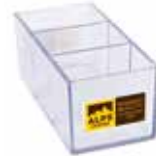
Art. 8320 Zuckerdisplay AC Portabustine AC Display for sugar AC 3 Stück/pezzi/pieces