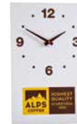
Art. 8360 Werbeuhr Orologio pubblicitario Advertising clock 24 x 38 cm