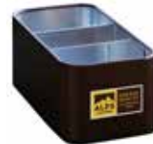
Art. 8321 Zuckerdisplay ACB Portabustine ACB Display for sugar ACB