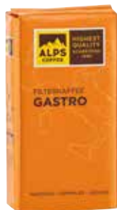
Art. 4621 Filterkaffee GASTRO 1000 g Gemahlen/macinato/ground

This smooth breakfast coffee captivates with its light subtle acidity. 95% Arabica beans from Central and South America, as well as 5% Robusta beans from South Asia define this mild coffee blend.