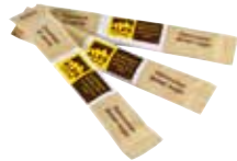
Art. 8021 Rohrzucker in Sticks Zucchero di canna in stick Cane sugar in sticks 2,8 g 10 kg Karton/cartone/carton