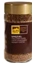
Art. 8090 Spezial 200 g Glas/bicchiere/jar