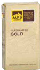
Art. 2021 Filterkaffee GOLD 1000 g Gemahlen/macinato/ground

The premium coffee for any time of day. An extremely aromatic filter coffee blend with a light subtle acidity. 100% Arabica beans from the best locations in Central America and East Africa give this composition its fine notes of mocha and its full and enveloping flavour.