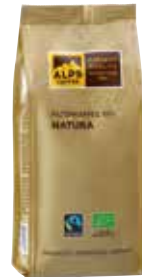
Art. 4341 Filterkaffee BIO NATURA 250 g Gemahlen/macinato/ground

Its friendly character and the balanced taste with a gentle note of mocha make this select coffee very special. 100% Arabica beans from Central America are grown organically and provide maximum enjoyment with particularly stomach-friendly characteristics. Coffee is Fairtrade certified, traded, audited and sourced from Fairtrade producers, total 100%.