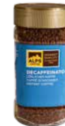
Art. 8091 Decaffeinato 200 g Glas/bicchiere/jar

Freeze-dried instant coffee, decaffeinated