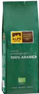
Art. 1260 Caffè Espresso BIO 100% ARABICA 500 g Bohnen/in grani/beans

A selected Arabica coffee from the best growing areas of Central and South America. A full body, very subtle and balanced acidity, as well as a lasting impressive aroma of dried fruit are the characteristics of this top-notch espresso. It is grown without any synthetic fertilisers and pesticides.