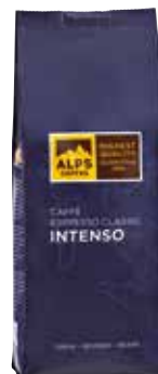
Art. 5620 Caffè Espresso Classic INTENSO 1000 g Bohnen/in grani/beans

A full-bodied, dark roast espresso blend, classy and strong. 60% Arabica beans from South America and Africa, as well as 40% Robusta beans from Africa and South Asia give this coffee its authentic aroma. Suitable for a perfect classical espresso.