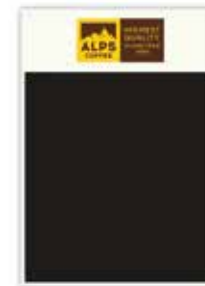
Art. 8341 Werbetafel Lavagna pubblicitaria Advertising board 50 x 70 cm