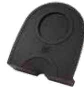
Art. 8887 Tampermatte Tappetino appoggio pressino Tamping mat