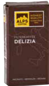
Art. 5021 Filterkaffee DELIZIA 1000 g Gemahlen/macinato/ground

Due to its dark roast, this strong filter coffee is of very low acidity. 80% Arabica beans from Central America and 20% Robusta beans from West Africa give this coffee blend its intensive taste, which receives its final touches from harmonious roasting aromas.