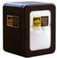
Art. 8323 Serviettenspender ACB Dispenser tovaglioli ACB Napkin dispenser ACB