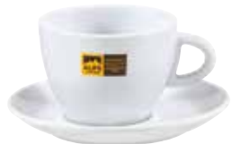
Art. 8303 Jumbotassen AC Tazze jumbo AC Jumbo cups AC 6 Tassen/tazze/cups