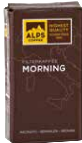
Art. 3021 Filterkaffee MORNING 1000 g Gemahlen/macinato/ground

The expressive filter coffee impresses with its strong taste and excellent roasting aromas. The coffee blend consists of 90% Arabica beans from Central and South America and East Africa, as well as 10% Robusta beans from South Asia.