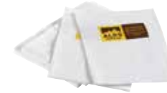
Art. 8326 Werbeservietten Tovaglioli pubblicitari Advertising napkins 2000 Stück/pezzi/napkins