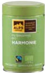
Art. 2343 Filterkaffee BIO HARMONIE 250 g Gemahlen/macinato/ground

A fashionable coffee, perfect throughout the day, made from 100% Arabica beans from selected organic plantations in Mexico, Peru and Honduras. The premium, full-bodied coffee with a light mocha note and subtle acidity impresses with its balanced and aromatic taste. Coffee is Fairtrade certified, traded, audited and sourced from Fairtrade producers. Certified, traded, audited and sourced from Fairtrade producers.