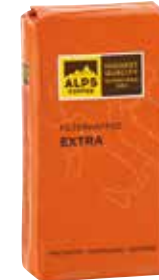
Art. 5541 Filterkaffee EXTRA 250 g Gemahlen/macinato/ground

The hearty filter coffee is compelling with its well-balanced acidity and spicy aromas. 90% Arabica beans from Central and South America and East Africa, as well as 10% Robusta beans from West Africa and South Asia give this coffee blend its typical aroma.