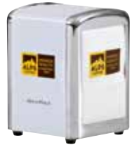
Art. 8325 Serviettenspender AC Dispenser tovaglioli AC Napkin dispenser AC