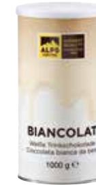
Art. 8056 Biancolat 1000 g Dose/barattolo/tin

Biancolat white drinking chocolate – Preparation for hot white-chocolate flavoured drink