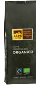
Art. 1920 Caffè Espresso BIO ORGANICO 1000 g Bohnen/in grani/beans

This espresso is very full-bodied and has a fine, subtle acidity. The delicious blend consists of 90% high-quality Arabica beans from the highlands of Central and South America, as well as 10% of selected Robusta beans from Southeast Asia. They are all organically grown and Fairtrade certified. Coffee is Fairtrade certified, traded, audited and sourced from Fairtrade producers, total 100%.